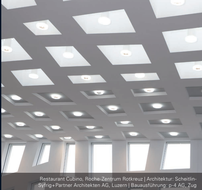
Restaurant Cubino, Roche-Zentrum Rotkreuz | Architektur: Scheitlin-Syfrig+Partner Architekten AG, Luzern | Bauausführung: p-4 AG, Zug